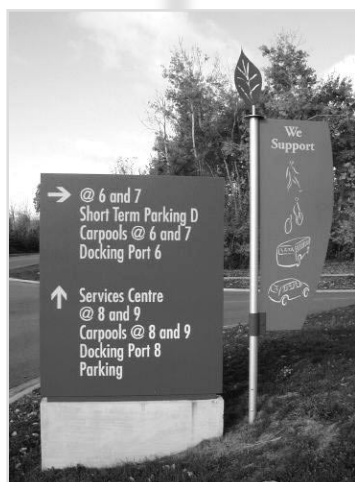
Signalisation de navigation chez Nortel Networks à Ottawa, Ont., qui donne un soutien clair aux options pour les navetteurs.

Votre organisme peut commencer par veiller à ce que les visiteurs puissent clairement voir les zones de stationnement de bicyclettes, les espaces de stationnement réservé pour les covoitures, les chemins pédestres et les arrêts de transports en commun. Vous pouvez mettre une signalisation spéciale pour confirmer que votre entreprise soutient les options pour les navetteurs. Vous pouvez également rappeler aux visiteurs différents moyens d'arriver à l'entreprise en incluant les itinéraires de transports en commun ou cyclistes sur toutes les cartes ou dans les directives vocales que vous leur donnez. Une carte de votre entreprise qui montre le stationnement des covoitures, le stationnement pour les bicyclettes, les chemins pédestres et les arrêts de transports en commun peut être aussi utile. Toutes ces mesures définissent au moins la position de chef de file qu'occupe votre organisme en matière de responsabilité environnementale.